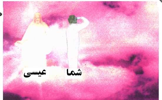
انجیل متی ۱۷

و بعد از شش روز عیسی پطرس و یعقوب و برادرش یوحنا را برداشته ایشانرا در خلوت بکوهی بلند برد. و در نظر ایشان هیئت او متبدل گشت و چهره اش چون خورشید درخشنده و جامه اش چون نور سفید گردید. که ناگاه موسی و الیاس بر ایشان ظاهر شده با او گفتگو میکردند. اما پطرس به عیسی متوجه شده گفت که خدایان ما در اینجا نیکو است. اگر بخوای سه سایبان در اینجا بسازیم یکی برای تو و یکی بجهت موسی و دیگری برای الیاس و هنوز سخن بر زبانش بود که ناگاه لبری درخشنده بر ایشان سایه افکند و اینک آوای از لبر در رسید که اینست پسر حبیب من که از وی خوشنودم. او را بشنوید.